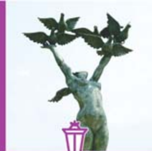
◀ Escultura "Paz" de Luis Sanguino.