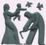
▶ Relieve escultórico. Edificio del antiguo Instituto Nacional de Previsión. Plaza del Carbayón. Vaquero Palacios.

Termómetro , situado en la confluencia con la calle Fruela, que es obra de Saiz Heres y que recibe su popular nombre por su verticalidad y las cristalerías curvas que atenúan su esquina. Frente a este edificio se encuentra el de la Junta General del Principado de Asturias, el Parlamento Autonómico, obra del arquitecto García Rivera, que data de 1904. García Rivera aplicó los recursos del eclecticismo clásico. Resulta un edificio robusto del que destacan, en su interior, su monumental escalinata central y los salones realizados con ricos materiales. En la calle Santa Cruz sobresalen varios edificios de diferentes estilos, incluido el modernista, con fachadas ricas en matices y colores cuya reciente remodelación ha sabido mantener las esencias arquitectónicas.