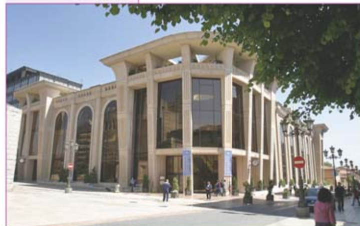
▲ Auditorio Príncipe Felipe.

Cerca de este lugar está la plaza de la Gesta, de forma cuadrangular y en uno de cuyos vértices se levanta el Auditorio y Palacio de Congresos "Príncipe Felipe". Se trata de una reciente construcción firmada por el arquitecto Rafael Beca, de estilo neoclásico que está levantada sobre el antiguo depósito de agua de Oviedo, hace años en desuso. El edificio aprovecha esta construcción, auténtica obra maestra de ingeniería civil, y la integra en su estructura. El interior del edificio, que acoge numerosas actividades tanto musicales como reuniones y congresos, ofrece espacios diáfanos y polivalentes de los que destaca la sala principal que puede llegar a acoger a 2.180 personas. Los grandes maestros de la música actual que han actuado en esta sala destacan especialmente su extraordinaria sonoridad.