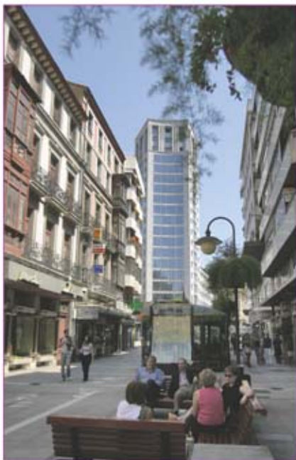
▲ Calle Palacio Valdés. Al fondo edificio "La Jirafa".

en el primer tercio del siglo XX. La iglesia se ubica en el inicio de la calle Melquíades Álvarez que mantiene buenos ejemplos de arquitectura expresionista y modernista. Esta calle entronca con Uría, auténtica arteria central de la ciudad, y donde se encuentran las tiendas de moda de