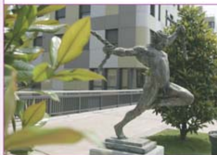
Escultura "Libertad" de Luis Sanguino. ▶

Detrás de este edificio, una pasarela sirve de comunicación de este espacio con los alrededores de la moderna estación de autobuses, que se localiza junto a otro nuevo hotel. Al