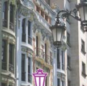
◀ Edificio de la Calle Santa Cruz.