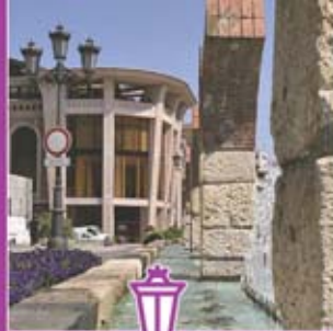
◀ Plaza de la Gesta.