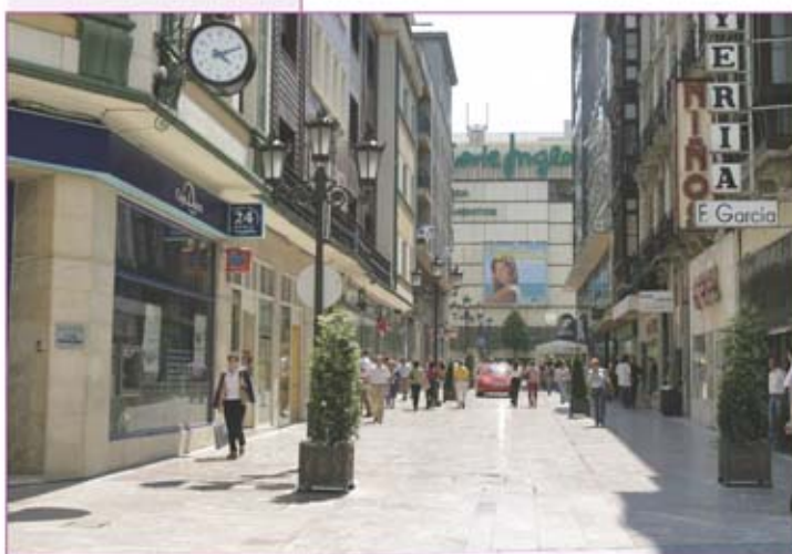
▲ Calle Doctor Casal.

primeras marcas a nivel mundial. Junto con la vecina Gil de Jaz, las firmas de los diseñadores más cotizados tienen su lugar preferente en el núcleo comercial ovetense. En este espacio se yerguen edificios de extraordinaria arquitectura entre las que destaca las denominadas "Casas del Cuito", en los números 27-29 de la calle Uría, levantado entre 1913 y 1917, muestra exteriormente el eclecticismo de la época junto a un barroquismo agotado. Tanto la fachada como el