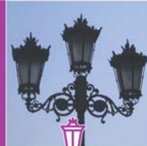
◀ Farola de fundición.