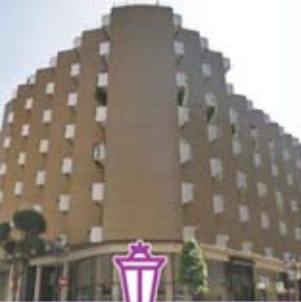
◀ Confluencia calle Cervantes y Matemático Pedrayes.