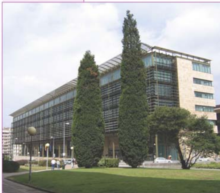
▲ Edificio Administrativo del Principado de Asturias.

Cerca de este lugar está la plaza de la Gesta, de forma cuadrangular y en uno de cuyos vértices se levanta el Auditorio y Palacio de Congresos "Príncipe Felipe". Se trata de una reciente construcción firmada por el arquitecto Rafael Beca, de estilo neoclásico que está levantada sobre el antiguo depósito de agua de Oviedo, hace años en desuso. El edificio aprovecha esta construcción, auténtica obra maestra de ingeniería civil, y la integra en su estructura. El interior del edificio, que acoge numerosas actividades tanto musicales como reuniones y congresos, ofrece espacios diáfanos y polivalentes de los que destaca la sala principal que puede llegar a acoger a 2.180 personas. Los grandes maestros de la música actual que han actuado en esta sala destacan especialmente su extraordinaria sonoridad.