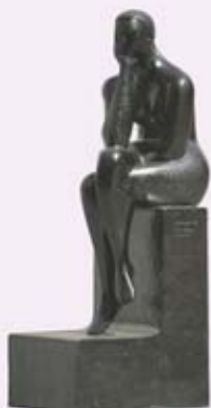
▲ Pensadora. José Luis Fernández. Calle Argüelles.

Situada estratégicamente en el centro de la región, y siendo ella misma, por su capitalidad, el centro de la actividad administrativa, económica, judicial y universitaria de Asturias, Oviedo muestra múltiples atractivos que la hacen destacar de forma patente. Oviedo es la capital del Principado de Asturias, cuenta en la actualidad con 205.000 habitantes, a los que ofrece una envidiable calidad de vida y, a sus visitantes, unas jornadas de tranquilidad, sosiego y descanso incomparables.