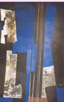
▲ Mural Vaquero Turcios. Hall Auditorio Príncipe Felipe.