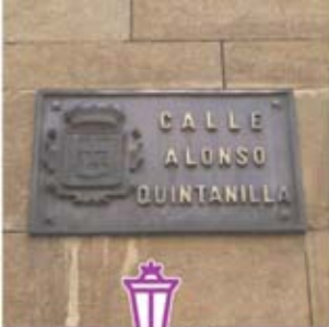
◀ Indicador de nombre de calle. En bronce fundido.