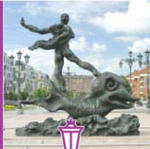
◀ Escultura "Hombre sobre delfin" de Salvador Dalí.