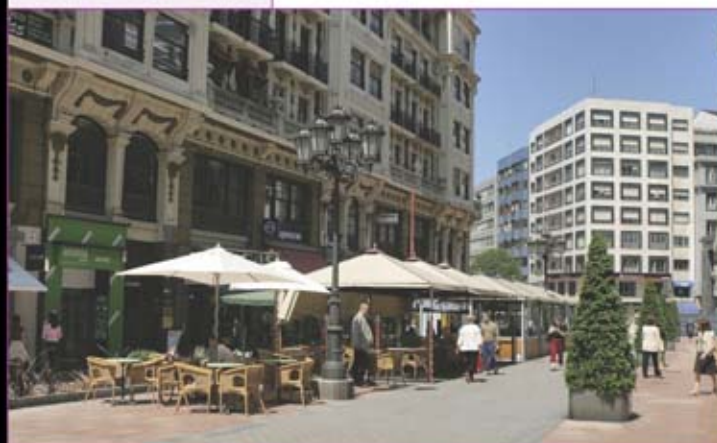
▲ Calle Milicias Nacionales.

Oviedo tiene dos centros: el histórico, protagonizado por la Catedral y el casco medieval que se desarrolló en su derredor; y el comercial, representado por la calle Uria y calles adyacentes, repletas de tiendas y comercios modernos, elegantes y variados, de marcas y nombres conocidos, con grandes escaparates donde se muestran las mercancías al siempre nutrido grupo de viandantes que pueblan estas vías en su mayor parte peatonalizadas.