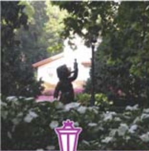
◀ Parque San Francisco.