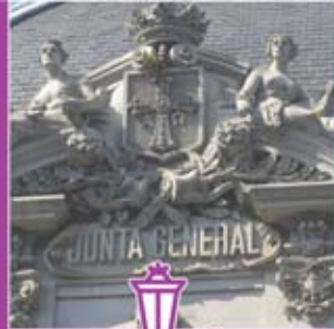
◀ Palacio de la Junta General del Principado. Detalle.