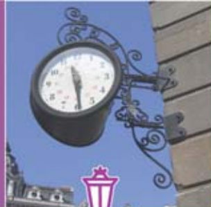
◀ Reloj de época en fachada.