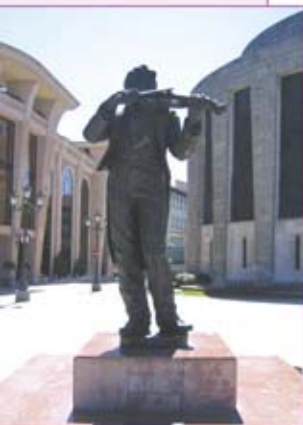
▲ Escultura "Violinista" de Mauro Álvarez.