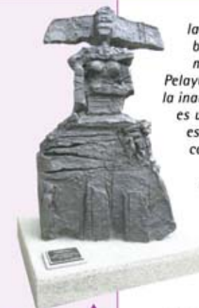
▲ Escultura "La Menina" de Orlando Pelayo. Edificio Pasarela, entrada hacia Ciudad Naranco. ▼

lado de la entrada principal del establecimiento se ubica la escultura "La menina" del escultor gijonés Orlando Pelayo, donada a la ciudad con motivo de la inauguración del complejo hotelero. Esta es una zona de reciente creación que se estructura en torno a una nueva vía de comunicación de la ciudad.