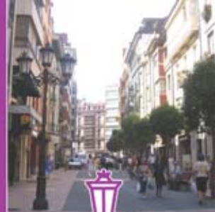
◀ Calle San Bernabé.