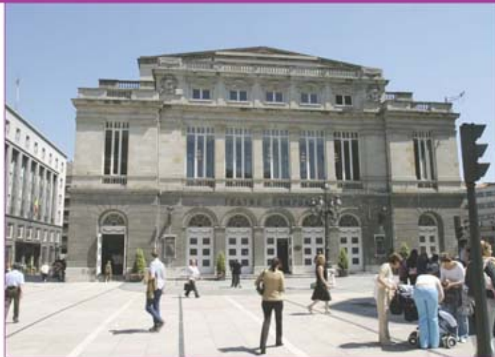
▶ Teatro Campoamor.