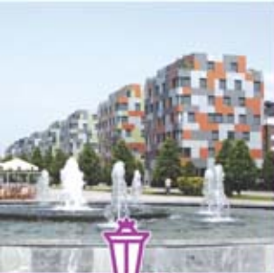
◀ Avenida de la Fundación Príncipe de Asturias. Extremo oeste.