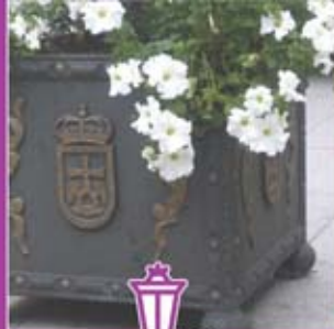
◀ Jardinera de hierro forjado.