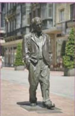
▲ Escultura "Woody Allen", de Vicente Santarua. Calle Milicias Nacionales.

en el primer tercio del siglo XX. La iglesia se ubica en el inicio de la calle Melquíades Álvarez que mantiene buenos ejemplos de arquitectura expresionista y modernista. Esta calle entronca con Uría, auténtica arteria central de la ciudad, y donde se encuentran las tiendas de moda de