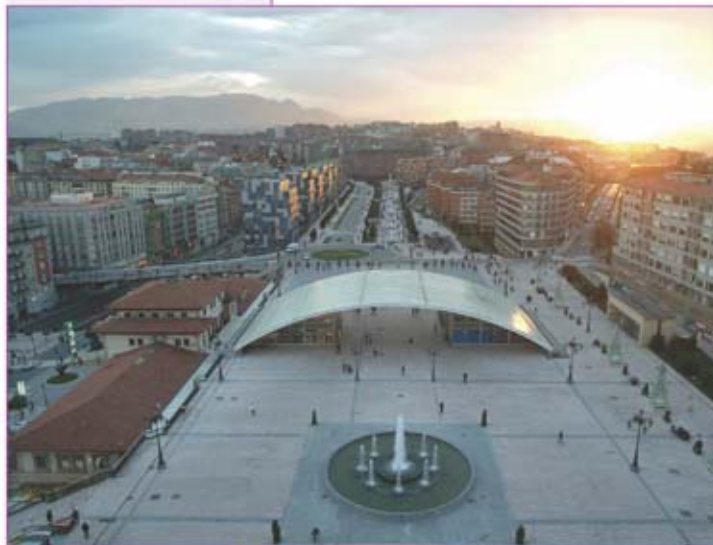
▲ Avenida de la Fundación Príncipe de Asturias.

En la plaza de los Ferroviarios, el nuevo espacio abierto sobre la estación propiamente dicha, se encuentra la escultura "Hombre sobre Delfin", de Salvador Dalí. Se trata de una copia autorizada de la obra que modeló el genio de Figueras con sus propias manos.