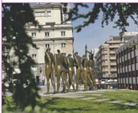
▶ Homenaje a la concordia. Esperanza D'Ors.

Desde la plaza de la Escandolera sale la calle