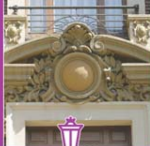
◀ Ornamento balcón.