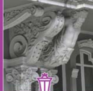
◀ Casa del Cuito. Detalle de un ornamento.